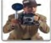
Un photographe مصور